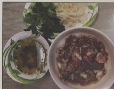
N1A. Hủ Tiếu Nam Vang Dried

N2. Hoàn Thánh - 8 pieces $9.50 Wonton Soup N2A: Mì (Noodles) $10.99