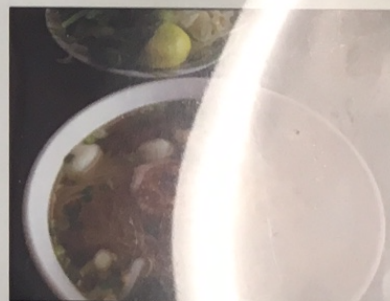
N1E. Hủ Tiếu Nam Vang Seafood

N6. Hủ Tiếu Bò Kho $10.95 Beef Stew with Rice Noodle