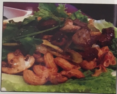
V1. Nui Xào Bò Lúc Lắc