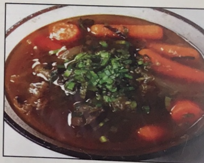
V2. Bánh Mì Bò Kho