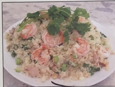
R2. Cơm Chiên Tôm Mực