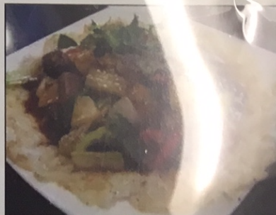
N8. Phở Áp Cháo Bò

N8. Phở Áp Cháo Bò MÌ XÀO giảm 11.99 Beef Pan-Fried Rice Noodles seated $11.99 N7A: Thập Cẩm - Combination beef $12.99