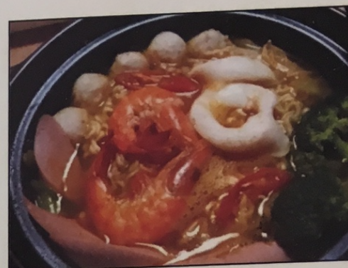
K1. Mì Cay Cấp Bậc 5