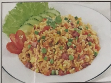
R1. Cơm Chiên Dương Châu