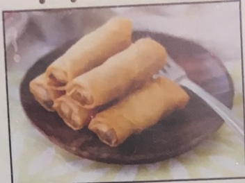
A1. Chả Giò